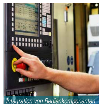
Integration von Bedienkomponenten