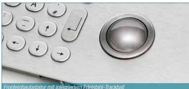
Fronteinbautastatur mit integriertem Edelstahl-Trackball

In diesem Bereich bieten wir ein umfassendes Sortiment an hochwertigen, gebrauchsfertigen Edelstahl-tastaturen. Diese können Sie bei uns einsatzbereit ab Lager beziehen. Grundsätzlich unterscheiden wir zwischen Einbautastaturen für die Systemintegration und Tastaturen im Gehäuse für den Einsatz auf dem Schreibtisch oder in Konsolen. Die Modellbandbreite reicht dabei vom beleuchteten Ziffernblock bis hin zur Einbautastatur mit Trackball.