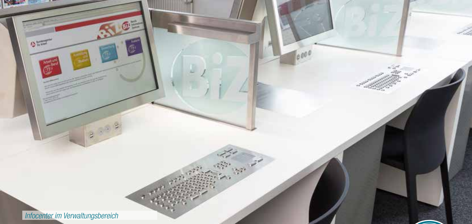
Infocenter im Verwaltungsbereich