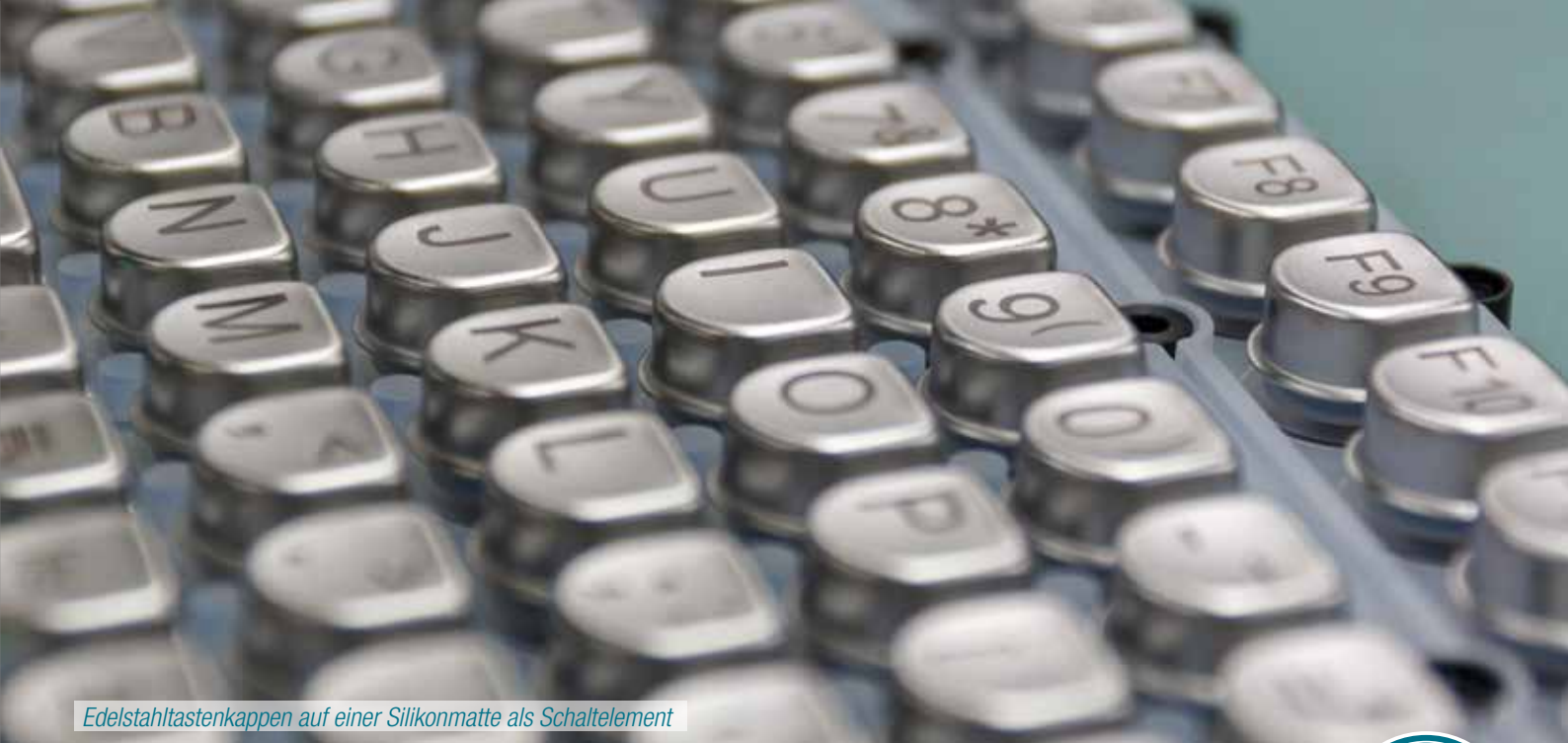
Edelstahlstastenkappen auf einer Silikonmatte als Schaltelement