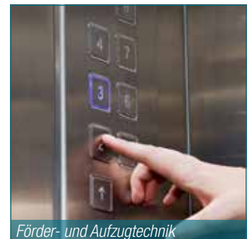
Förder- und Aufzugtechnik